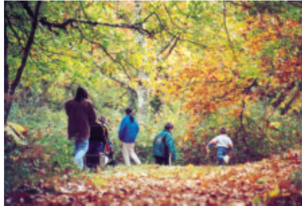
Paseo con carrito para niños.