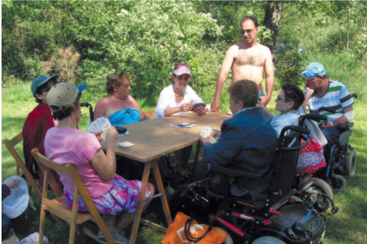
Accesos y adecuación a minusválidos en el robledal.

posible impacto ambiental de esta actividad en ocasiones masiva. Las actividades de uso público más comunes son: pasar el día, comidas campestres, pasear, actividades informales al aire libre, contemplativas, deporte compatible, juegos, conciertos, etc.