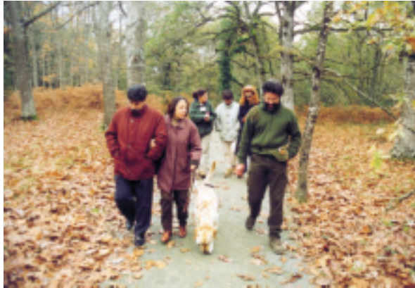
Paseo por el robledal de un grupo de ciegos.