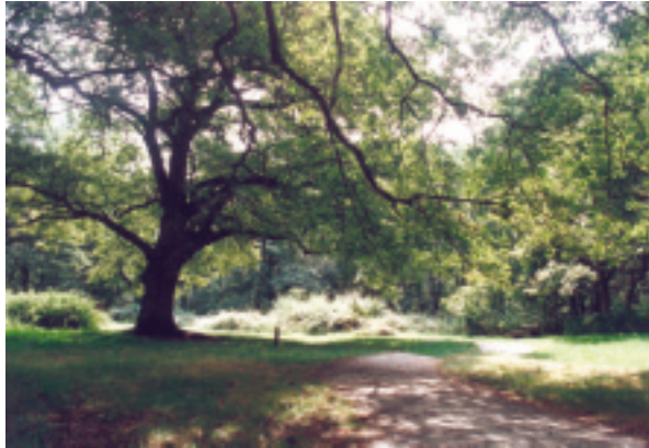
Robledal de Orgi.