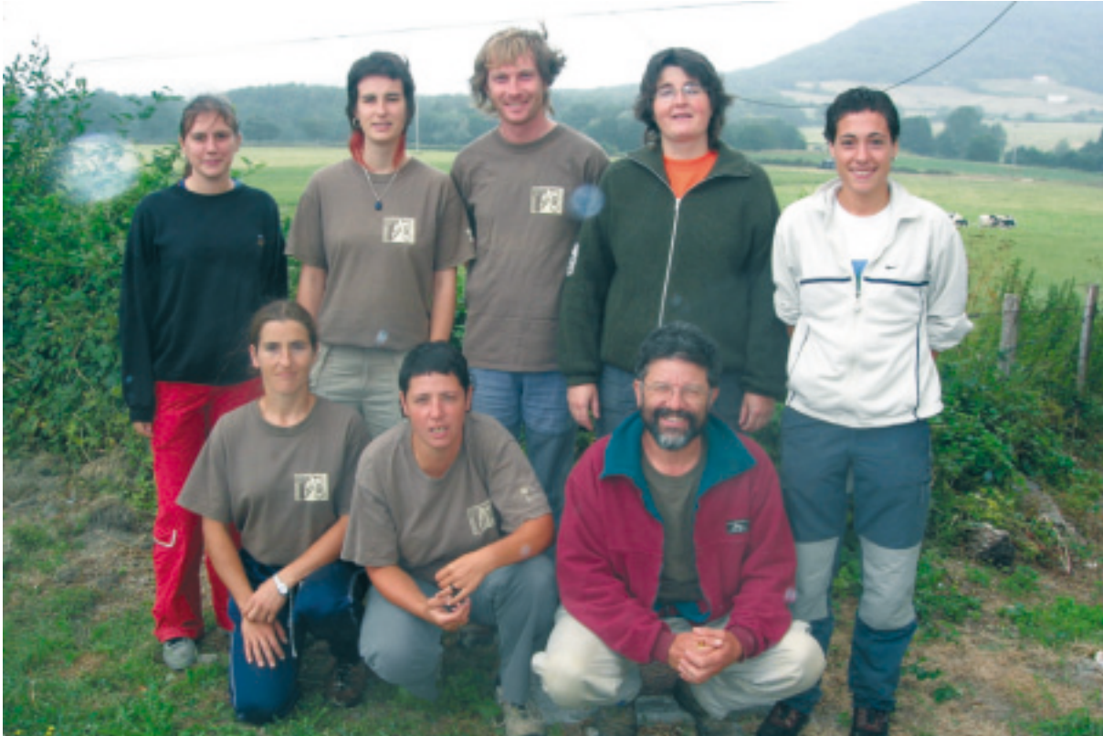
Equipo de Orgi.